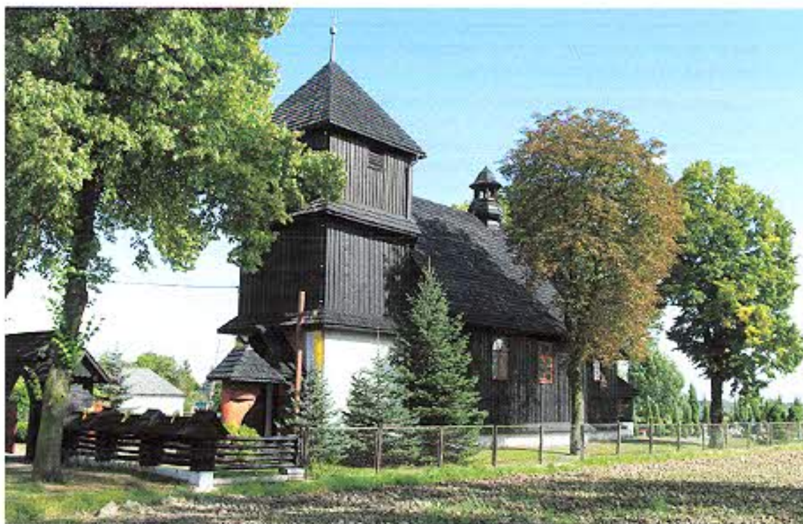
Kościół filialny p.w. św. Judy Tadeusza w Przewozie, gm. Cisek

Najstarszym, zachowanym na terenie powiatu kędzierzyńsko-kozielskiego drewnianym kościołem prezentującym schemat prostego, jednonawowego kościółka z trójbocznie zamkniętym prezbiterium i kwadratową wieżą od zachodu jest kościół w Przewozie. Zbudowany w 1559 r. w Gierałtowicach w gminie Reńska Wieś, przeniesiony na obecne miejsce w 1937 r. Wzniesiony w konstrukcji zrębowej, na zewnątrz oszalowany, wieża w dolnej części murowana, w górnej konstrukcji słupowej. Bryłę ożywia usytuowana w kalenicy nawy ośmioboczna sygnaturka zwieńczona hełmem baniastym z latarnią. Wnętrze z otynkowanymi ścianami, nakryte stropami płaskimi, oświetlone jest oknami umieszczonymi wysoko, w ścianach bocznych nawy. Urok malowniczego kościoła podkreśla drzewostan i stylowe ogrodzenie zbudowane już w czasach współczesnych.