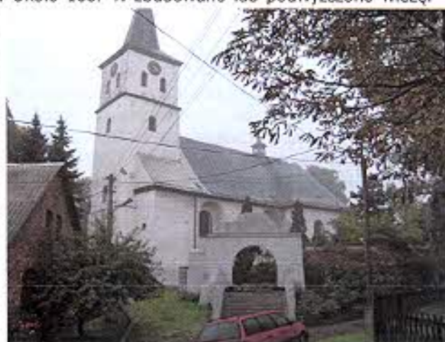
Kościół Wniebowzięcia NMP w Gościęcinie.

Wczesnobarokowy kościół Wniebowzięcia NMP w Gościęcinie wzniesiono w poł. XVII w. na niewielkim wyniesieniu terenu, pośrodku wsi. Około 1687 r. zbudowano lub podwyższono wieżę. Jednoprzestrzenny w systemie filarowo-emporowym jest zapowiedzią baroku na Śląsku Opolskim, antycypuje jego najwspanialsze realizacje takie jak kościół jezuitów w Nysie. Jednoprzestrzenne wnętrza nakrywają sklepienia kolebkowo-krzyżowe, w emporach sufity z kolistymi stiukowymi plafonami. W zamknięciu prezbiterium znajduje się jeden z najciekawszych na Opolszczyźnie przykładów plastyki barokowej - grupa rzeźbiarska Wniebowzięcia NMP