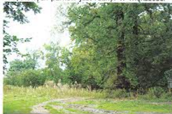
Nacyszławki, gm. Reńska Wieś – Park

i odnowy zieleni, uszkodzonym systemem melioracyjnym, dewastacją w okresie powojennym, wyrębem drewna na opał i cele gospodarcze oraz zarastaniem gęstym samosiewem.