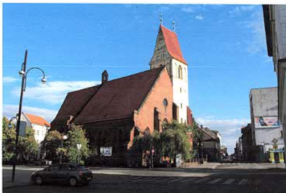
Kościół parafialny p.w. św. Zygmunta w Kędzierzynie-Koźlu.

Malownicza bryła kościołów zaakcentowana zwykle wysoką wieżą stanowi dominantę przestrzenną w krajobrazie miejscowości i nadaje jej własny, odrębny charakter zdeterminowany metryką i stylistyką oraz usytuowaniem zabytku.