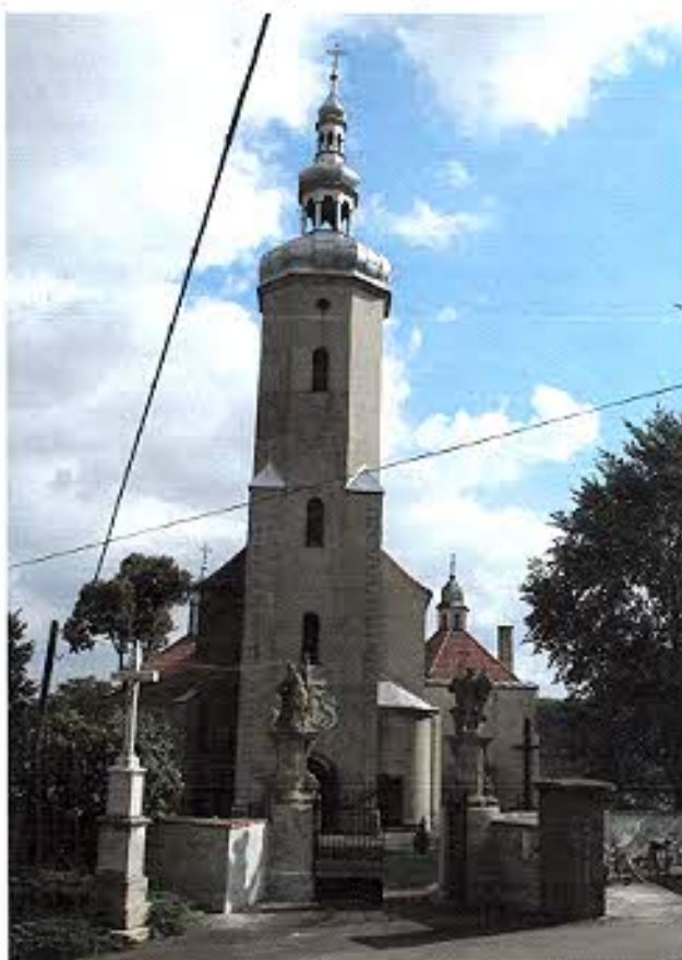
Kościół Wniebowzięcia NMP w Polskiej Cerekwi.

Najwcześniejszą realizacją stylu barokowego jest dokonana na pocz. XVII w. przebudowa późnogotyckiego kościoła Wniebowzięcia NMP w Polskiej Cerekwi. W 1617 r. z fundacji Fryderyka von Oppersdorff budowa przy drugim przęśle nawy od wschodu kaplicy św. Barbary nakrytej kopułą, w 1763 z fundacji rodu von Gaschin dobudowa od północy kaplicy św. Antoniego nakrytej sklepieniem kolebkowo-krzyżowym i owalną kopułą. Znacznie uszkodzony w czasie II wojny światowej, odbudowany w latach 1945-48 w stylu neobarokowym. W otoczeniu kościoła osiemnastowieczny mur z późnobarokową bramką od zachodu fundowaną w 1780 r. przez Antoniego von Gaschin. Po obu stronach na kamienne figury śś. Floriana i Barbary na postumentach.