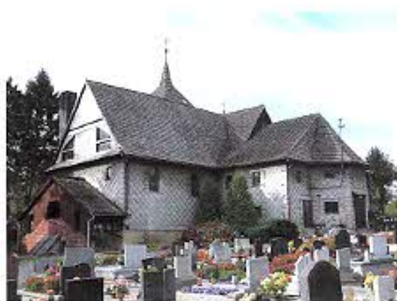
Kościół p.w. św. Jadwigi we wsi Radoszowy.

Obecny kościół zbudowany w 1730 r. na miejscu poprzedniego, gotyckiego. W 1929 r. został powiększony przez wbudowanie poprzecznie w nawę barokowego kościoła obecnego korpusu. Dawne prezbiterium zamknięte trójbocznie, od zach. kwadratowa wieża. Wzniesiony w konstrukcji zrębowej, na zewnątrz pobity eternitem. Wewnątrz zachowane pozorne sklepienia kolebkowe oraz cenne wyposażenie m.in. ołtarze stylu regencyjnym i rokokowym oraz barokowa ambona