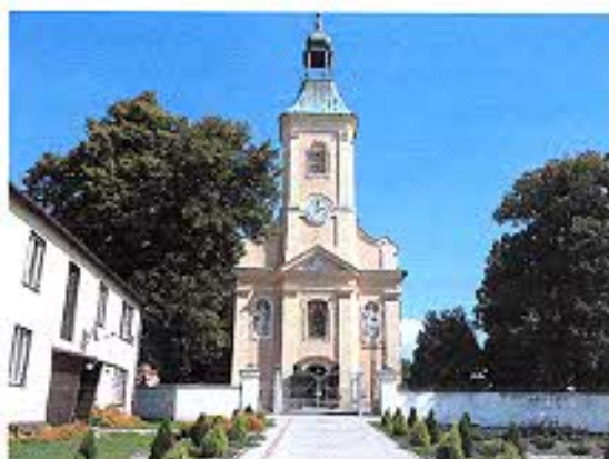
Kościół p.w. św. Floriana w Maciowakrze.