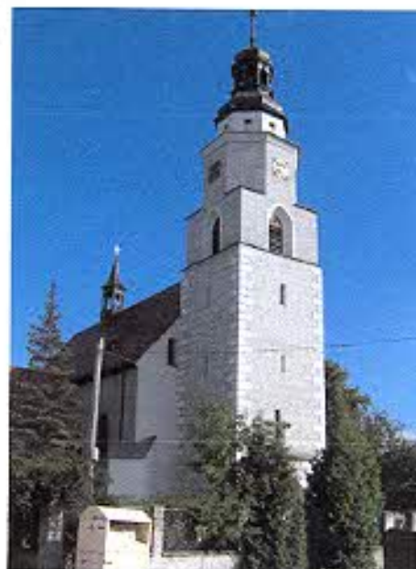
Kościół p.w. św. Trójcy w Bierawie.

Sgraffito znane już w średniowieczu, epoce renesansu i manieryzmu zawdzięcza rozwój i rozpowszechnienie. Jako wykonana w tynku imitacja ciosów kamiennych stało się wówczas bardzo modne, pokrywano nim ratusze, kamienice, rezydencje i kościoły.