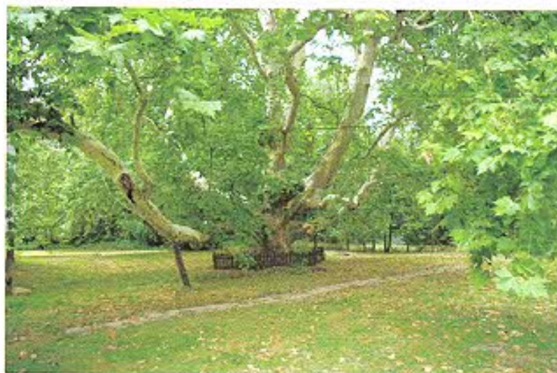
Komorno, gm. Reńska Wieś – park z okazowy platanem.

Założenia parkowe wzbogacają okolice o nowy, malowniczy składnik.