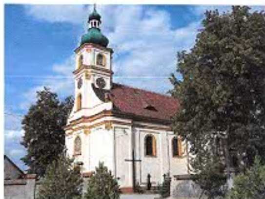
Kościół p.w. św. Stanisława w Naczęsławicach.

Kościół o zwartej, nakrytej ceramicznym dachem dwuspadowym bryle posiada w elewacji frontowej czworoboczną wieżę wtopioną w korpus. Fasada o płynnej linii z narożnikami zaokrąglonymi i wklęsłymi, półszczytami ze spływami i bogatą artykulacją pilastrami i wyładowanymi gzymsami prezentuje już w pełni wykształcone cechy barokowe.