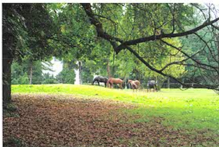
Zakrzów, gm. Polska Cerekiew – polana parkowa.

Obowiązkiem właścicieli i samorządów są działania zmierzające do wyeksponowania istniejących, oryginalnych elementów zabytkowego układu parku, wykorzystania ich do turystycznego zagospodarowania i innych w/w funkcji. Aby spełnić te postulaty podobne zadania powinny się także znaleźć w gminnych programach opieki nad zabytkami.